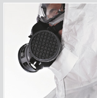
Faixa de queixo