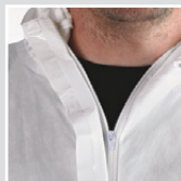
Fecho único com aba reutilizável